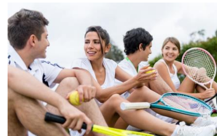
Mitgliederstatistik nach Altersgruppen im Bayerischen Tennis-Verband 2020/2021