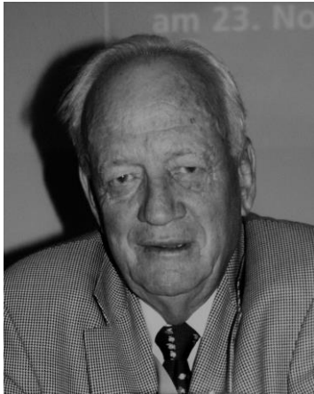
Dr. Peter von Pierer